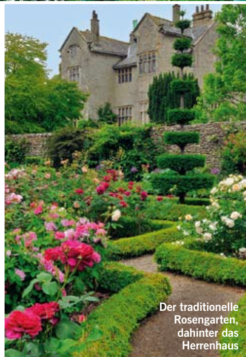
Der traditionelle Rosengarten, dahinter das Herrenhaus