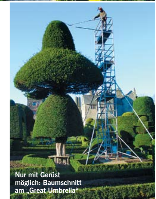
Nur mit Gerüst möglich: Baumschnitt am „Great Umbrella“