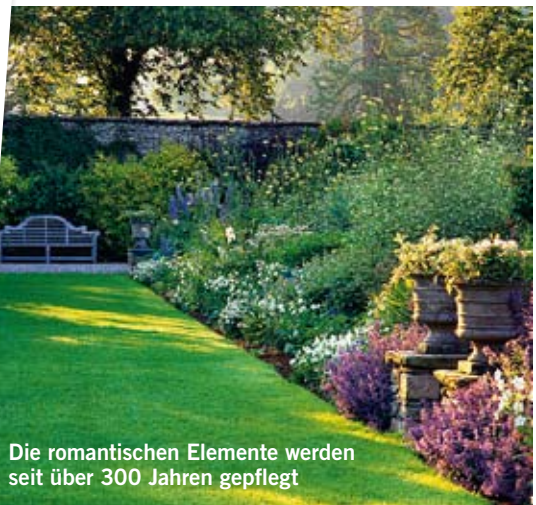
Die romantischen Elemente werden seit über 300 Jahren gepflegt