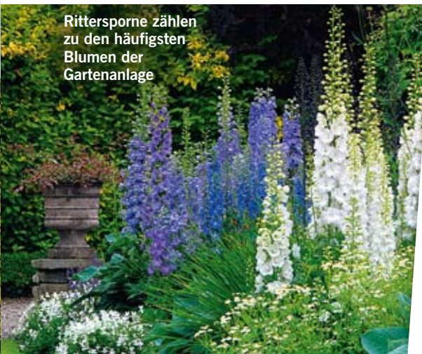
Ritterspore zählen zu den häufigsten Blumen der Gartenanlage