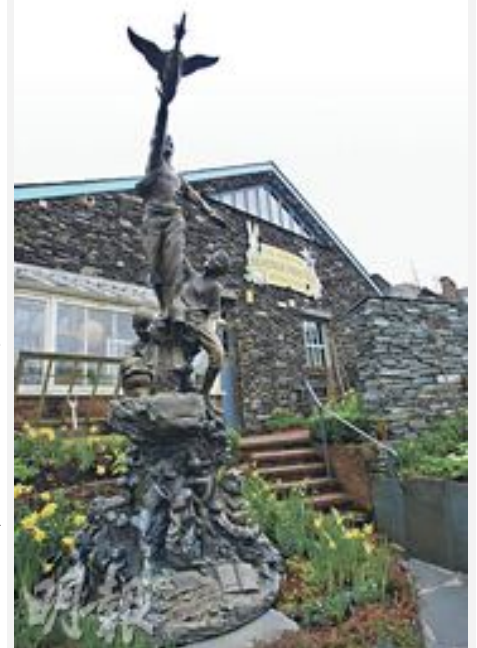
Beatrix Potter熱愛田園生活，關於她的景點不能缺少花園。