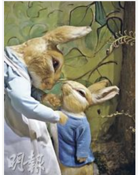
兔媽媽為小兔彼得穿上經典的粉藍外套。