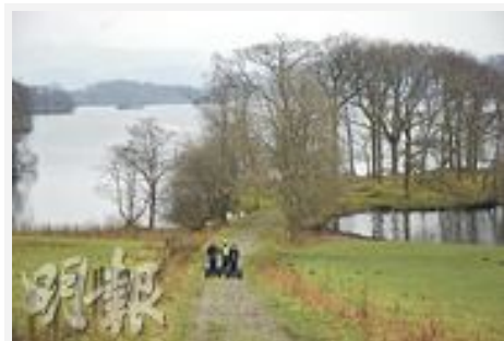
在湖區，賽格威的速度控制在時速12英里以下，遊覽風光時省力又安全。

除牧羊犬外，湖區也設有賽格威（Segway）行程。賽格威是電動車，感應人體前後左右走動，只要掌握駕駛技術，我們毫不費力就能輕輕鬆鬆上山下地。Lakeland Segway的初級行程，約一小時，先有